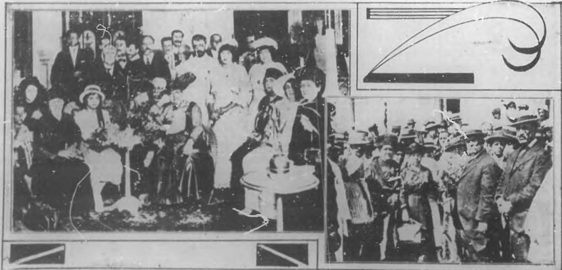
LOLA RODRIGUEZ DE TIÓ EN PUERTO RICO.—Fotografía tomada en el hotel Inglatera, momentos después de haber llegado la poetisa (X) a San Juan, donde se vió rodeada por elementos valiosos de las letras, de las artes y de la sociedad portorriqueña.—La inspirada poetisa (X) en los momentos de desembarcar en San Juan, rodeada de las distinguidas personas que fueron al muelle a saludarla.

Hacia falta un semanario de esta índole, el cual fuese la obra de generosas voluntades.