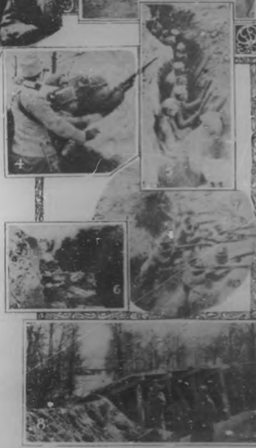
1. Entrada de una vivienda construida en las trincheras.—2. En comunicación con el Cuartelmaestre General desde la primera línea de trincheras.—3. Un cocinero en las trincheras.—4. Una trinchera sucia, al norte de los Cirpatos.—5. T-90 de trinchera profunda; trinchera-fosa.—6. La trinchera abandonada.—7. Una trinchera en actividad.—8. Trinchera cubierta con techo de madera.