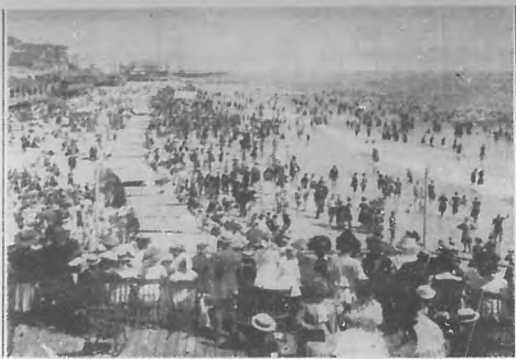
Vista de las cataratas del Niágara.

Para más informes, reservaciones y billetes, diríjase a la PENINSULAR & WESTERN STEAMSHIP CO. O'Reilly 4. Teléfono A-6578 — HABANA.