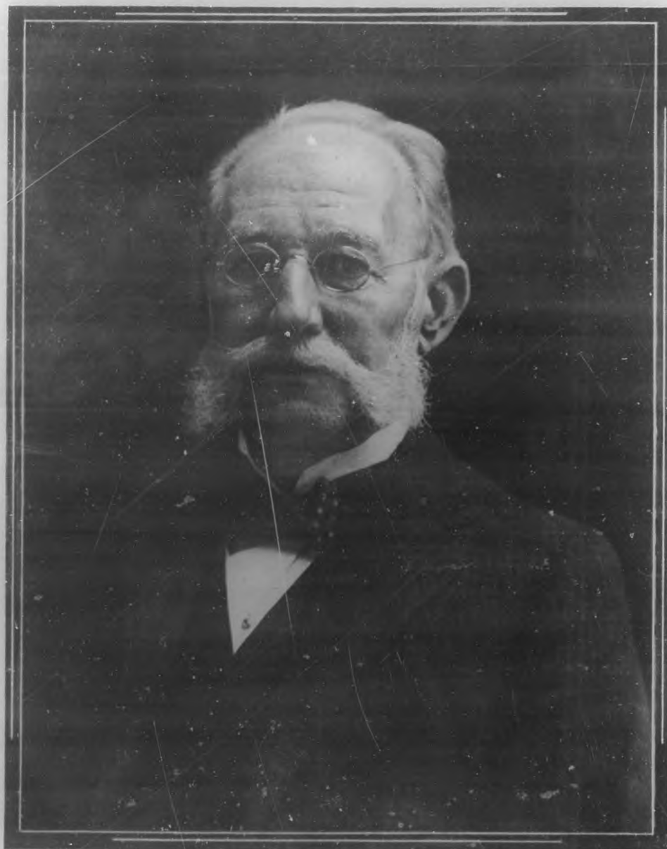
DR. CARLOS FINLAY

Ilustre y sabio médico cubano, muerto en la tarde del próximo pasado viernes en esta ciudad. Con su nunca bien llorada muerte, pierde Cuba uno de sus más gloriosos hombres de ciencia, pues el Dr. Finlay era el descubridor de la célebre teoría sobre la propagación de la fiebre amarilla por el mosquito. Por sus muchos méritos tuvo el honor de ser propuesto para la obtención del "Premio Nobel". ¡Descanse en paz el ilustre fenecido!