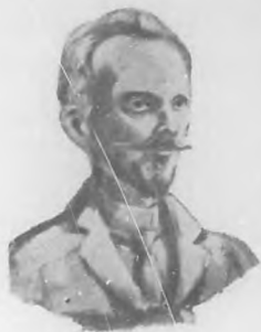
Coronel Indalecio Sobrado y Lago